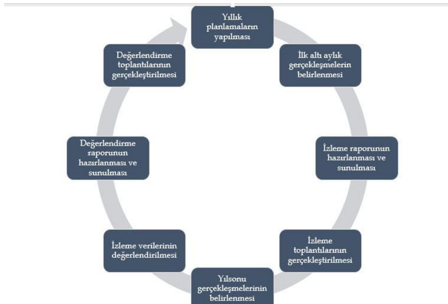
Şekil 8.2: İzleme ve Değerlendirme Süreci İşleyişi

Stratejik plan değerlendirme raporu, üst yönetici başkanlığında yapılan değerlendirme toplantısında stratejik planın kalan süresi için hedeflere nasıl ulaşılacağına ilişkin alınacak gerekli önlemleri de içerecek şekilde nihai hale getirilerek raporlaştırılacaktır.Şekil 8 Stratejik Plan İzleme ve Değerlendirme Modeli