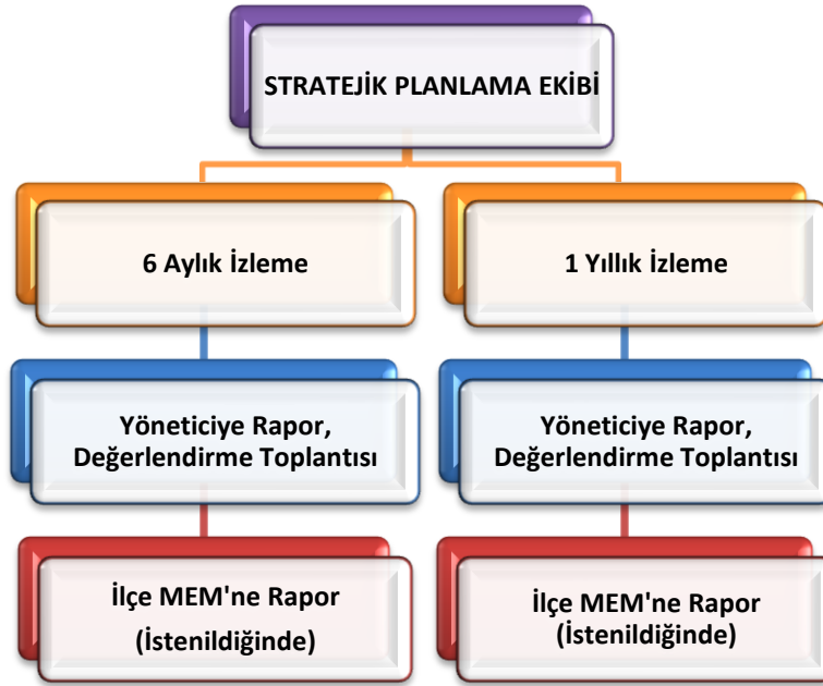
Şekil 8.1: İzleme ve Değerlendirme Süreci

Yıllık planın uygulanmasında yürütme ekipleri ve eylem sorumlularıyla aylık ilerleme toplantıları yapılacaktır. Toplantıda bir önceki ayda yapılanlar ve bir sonraki ayda yapılacaklar görüşülüp karara bağlanacaktır.